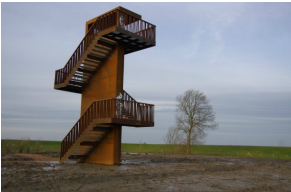
Natuurgebied Spuimond West