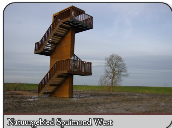
Natuurgebied Spuimond West